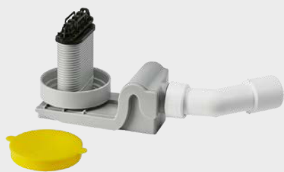
Model KA 4121