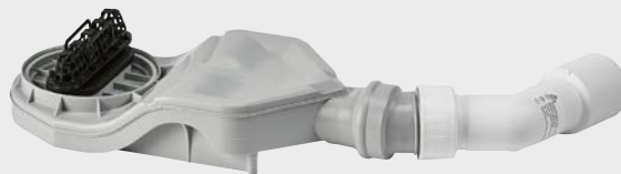
Model KA 4122